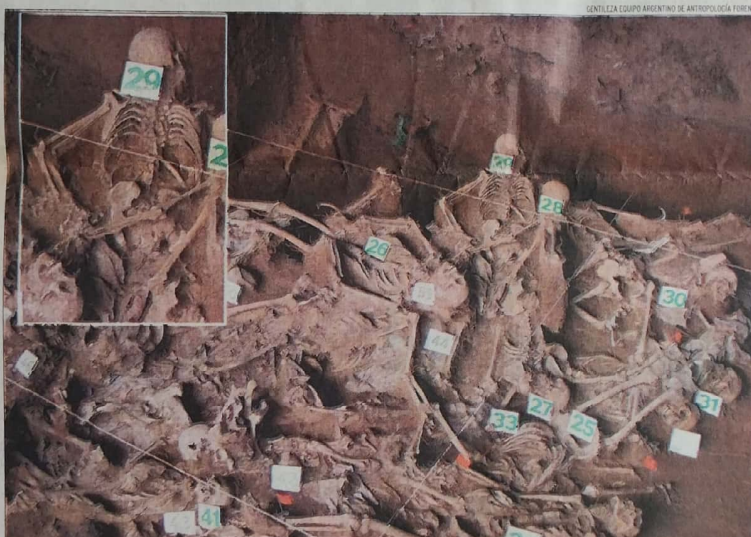
COMO UN CAMPO DE CONCENTRACIÓN. En el ángulo superior izquierdo se puede observar las ataduras que tenían algunos cuerpos. La numeración es para ordenar el trabajo y luego ir guardándolos en las cajas correspondientes.

Luego, tendrá que pasar por ese momento íntimo y único: recibir los restos de su hijo. Quizá, luego pueda ella tener un poco