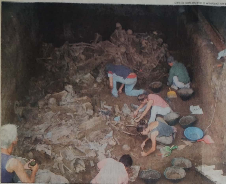
TRABAJO DE HORMIGAS. Los peritos y colaboradores realizan un trabajo de cirujanos. Deben seleccionar y limpiar cada resto con sumo cuidado, ya que no pueden mezclarse las piezas porque eso dificultaría la posterior identificación.