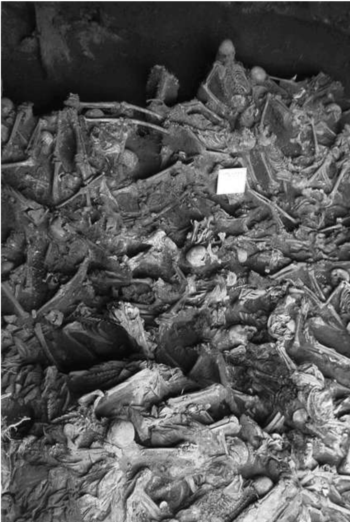
Figura 1: Cementerio de San Vicente, Sector C. Cabecera Norte, Piso 2

(priorizando adolescentes y adultos jóvenes sobre adultos seniles), signos de muerte violenta (fracturas perimortem, balística, etc), o a indicios de personas que no forman parte de una muestra regular de morgue (ropa asociada, desarticulación