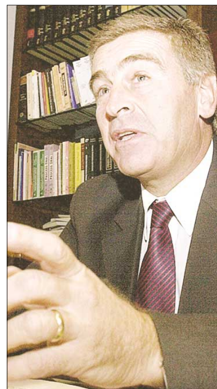
Aguad, dos candidaturas en un año.